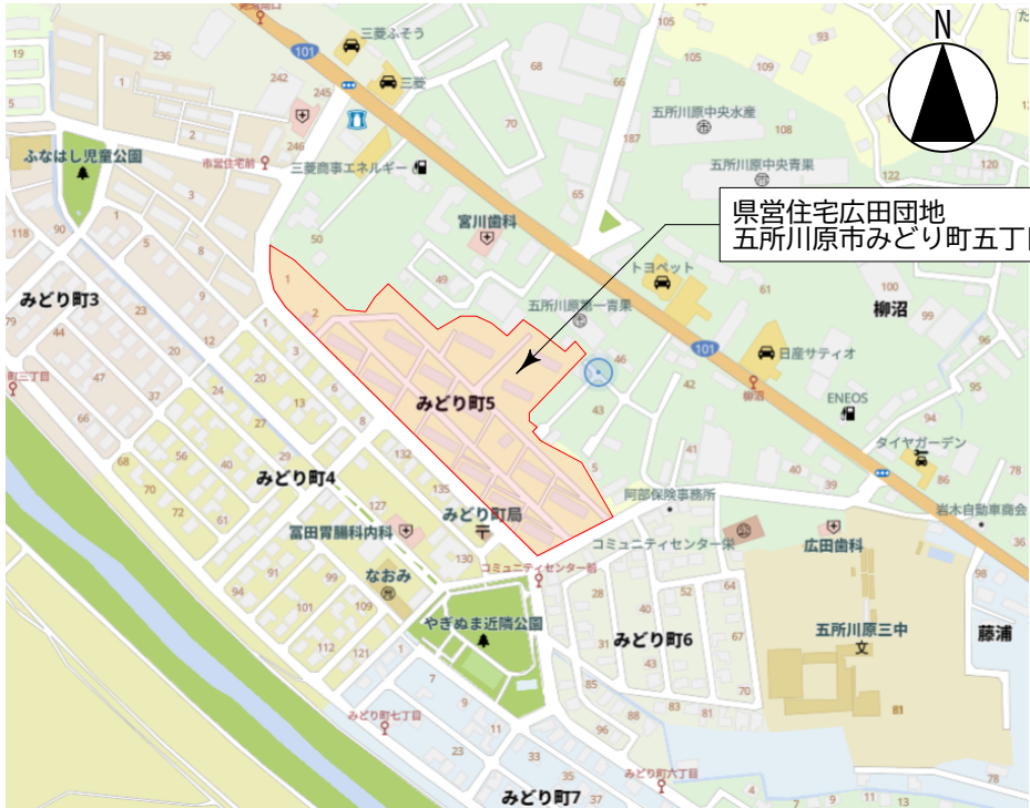
県営住宅広田団地 五所川原市みどり町五丁目地内