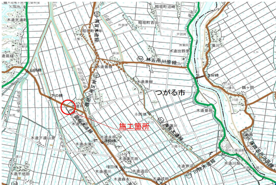
位 置 図