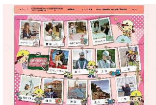
HP、ブログでの情報発信

男女問わず誰もが働きやすい建設業界を実現するため、あおもり女建ネットワーク（H27.10 設立）や業界団体と連携して、建設業への女性の入職・就業継続の促進に向けた取組を実施します。