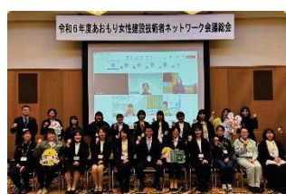
ネットワーク会議