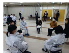
女子学生との懇話会

今年度も女性活躍に向けた取組を実施していくとともに、 建設業で働く女性の会員（事務職の方も可）及び応援企業を募集 しています。詳しくはホームページをご覧ください。 https://aomorikensetuko.com/71833/