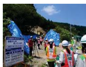
建設女子現場見学会